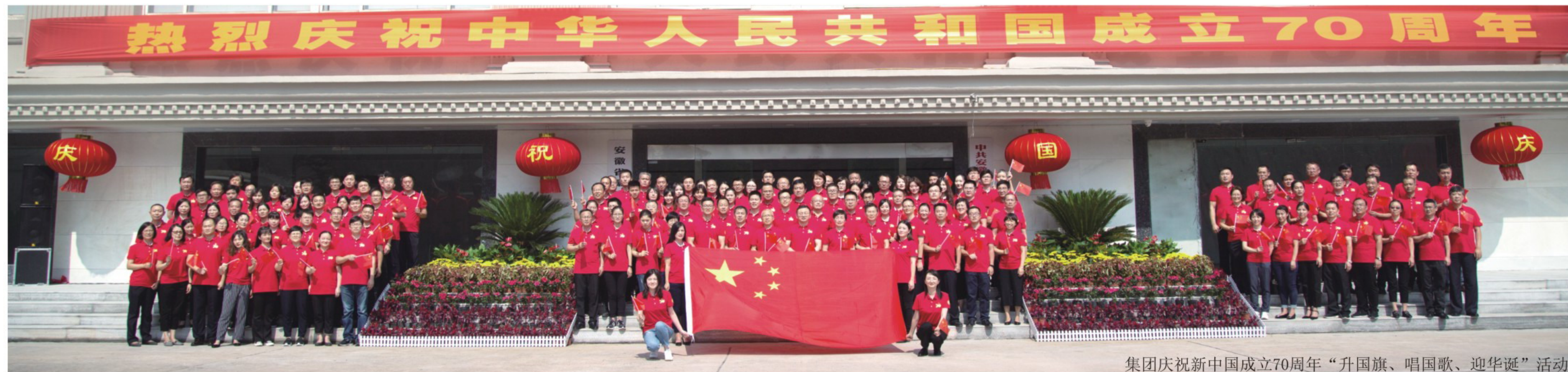
集团庆祝新中国成立70周年“升国旗、唱国歌、迎华诞”活动

热情接待来访，寻求解决方案。积极组织慰问困难党员职工、“金秋助学”、“送温暖”、“送清凉”等活动，传递组织关怀和温暖。迅速广泛动员救助突发重大疾病员工，真正体现“徽商一家亲”。