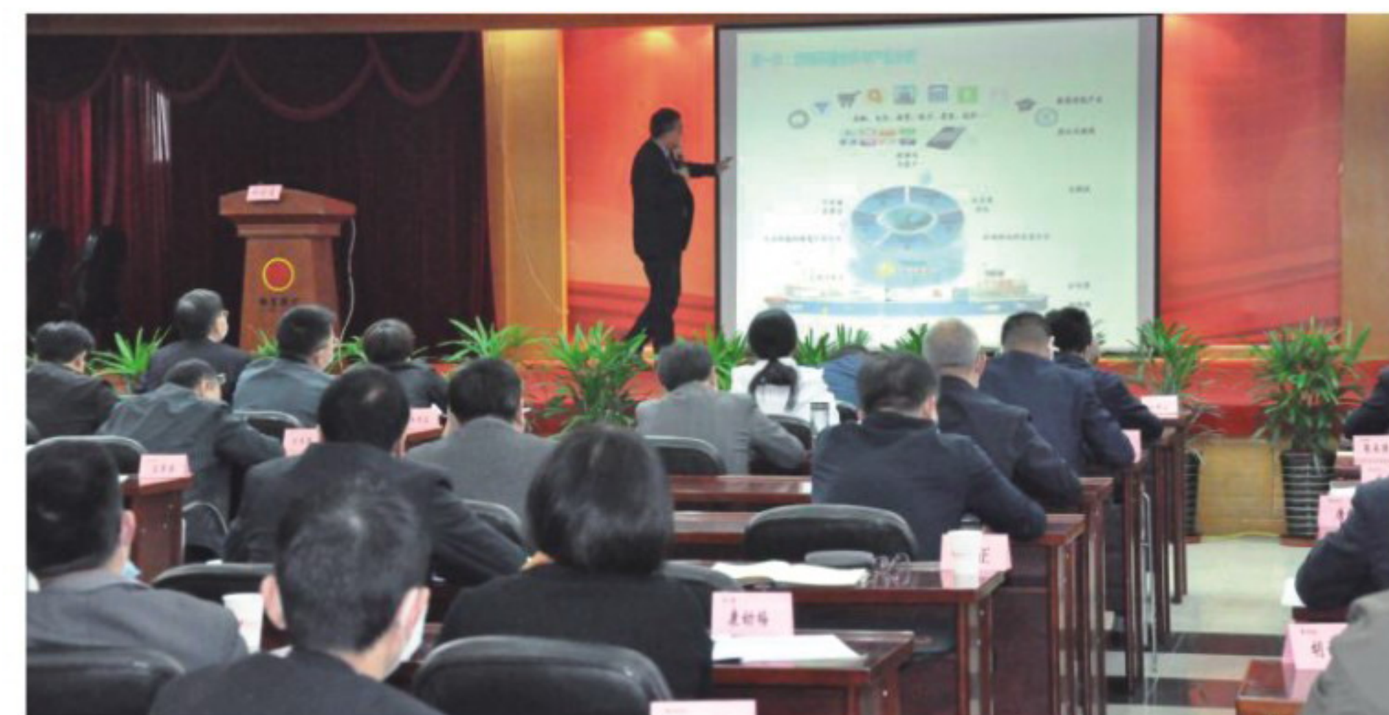
▲第十二期徽商大讲堂——企业顶层设计授课现场

举办9期徽商大讲堂，累计参训人数1200多人次。制定《徽商集团中层管理人员管理办法》，建立较为系统的管理机制和能上能下的使用机制。徽商期货公司博士后工作站成功获批。