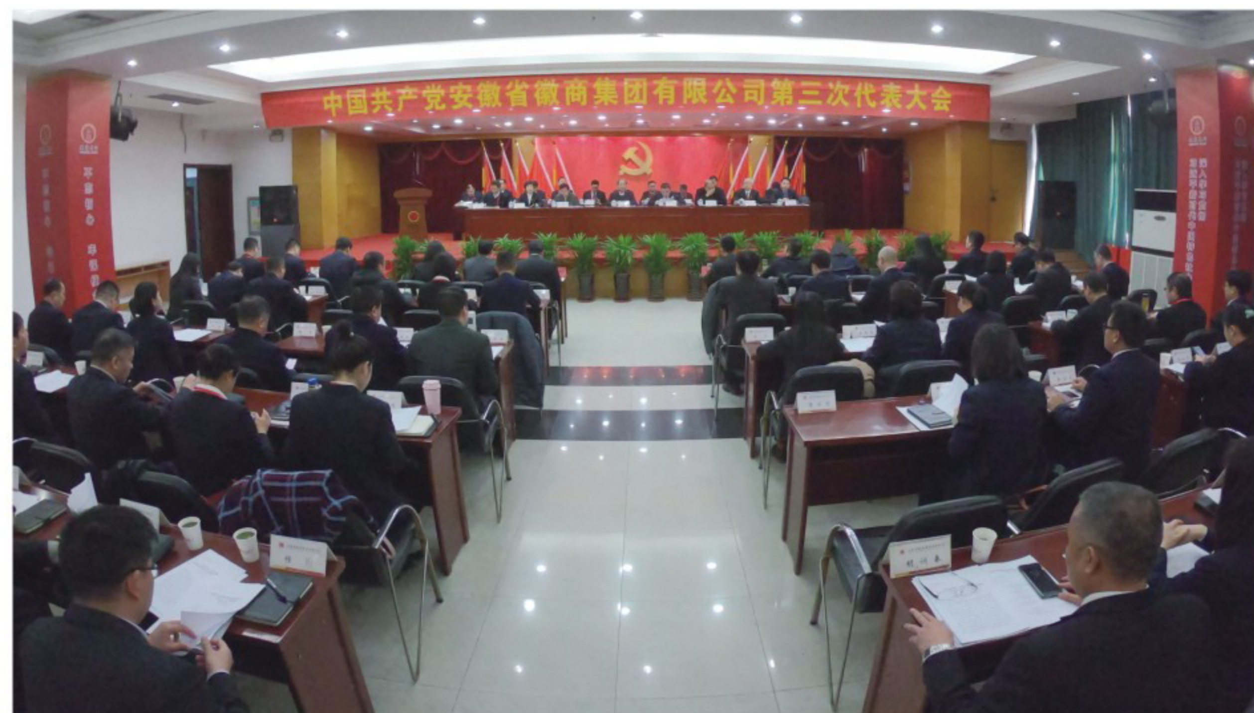
▲集团第三次党代会现场

2019年12月31日，中国共产党安徽省徽商集团有限公司第三次代表大会在集团二楼多功能厅隆重召开。