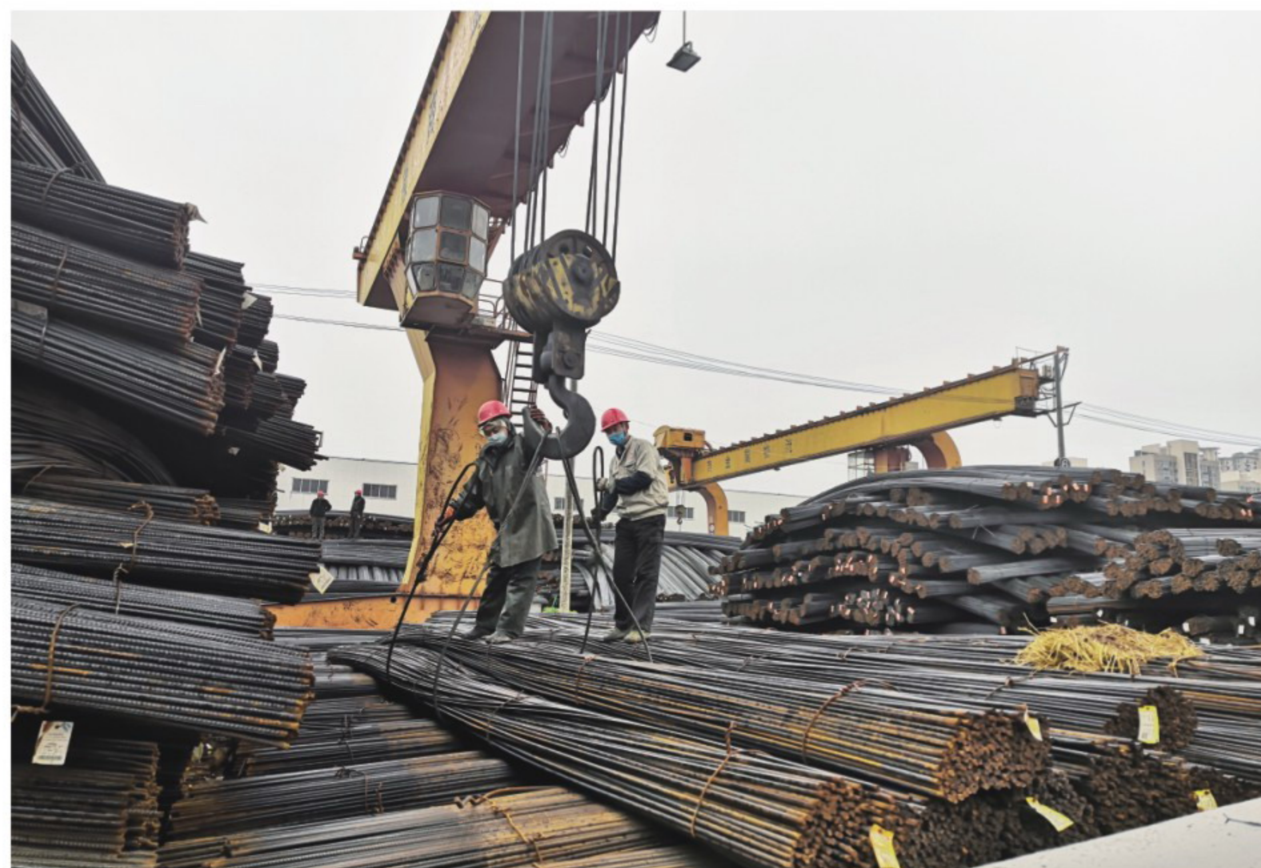
▲徽商物产钢材基地

纪要精神，与各债权银行就整体债务问题达成一致意见，增强金融机构信心，避免了金融风险。推进徽商创元公司问题处置进入法律渠道，信访量从近百起降至零上访。新组建法务风控部，成立防范化解重大风险工作领导小组和6个专项工作组，全面排查、应对各类风险隐患。二是加强制度建设。开展建章立制“回头看”，集团总部修订制度5项、新制定9项、废止12项。加强制度执行力建设，强化工作督办，集团总部印发督办通报37期。三是推进清单式管理。集团总部实行工作清单制度，建立完善资产、财务、人力、诉讼等数据库。四是强化母子公司管控。加强经营调度体系建设，强化预算指标分解落实，突出苗头性、异动性趋势分析。启动财务信息化建设，实行直属公司财务总监委派制，严控财务风险。组建审计督导部，强化审计整改对规范各公司经营行为的作用。