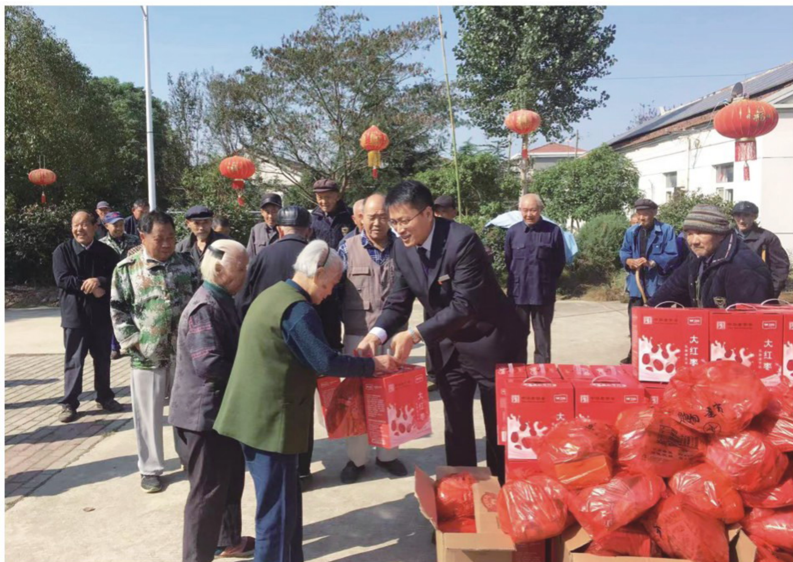
▲商之都巢湖商厦“志愿敬老行”活动

以打造现代流通综合服务商为目标，发挥流通业、服务业连通上下游优势，诚信经营，推进产业发展和客户成长。徽商期货公司为全国数百家实体企业提供专业服务，根据实体企业需要量身定制套期保值方案，帮助客户利用期货工具进行风险管理，有效规避了价格巨幅波动的风险，助力实体企业稳健增长。商之都推广“睦邻计划”，广泛开展服务客户的志愿活动。