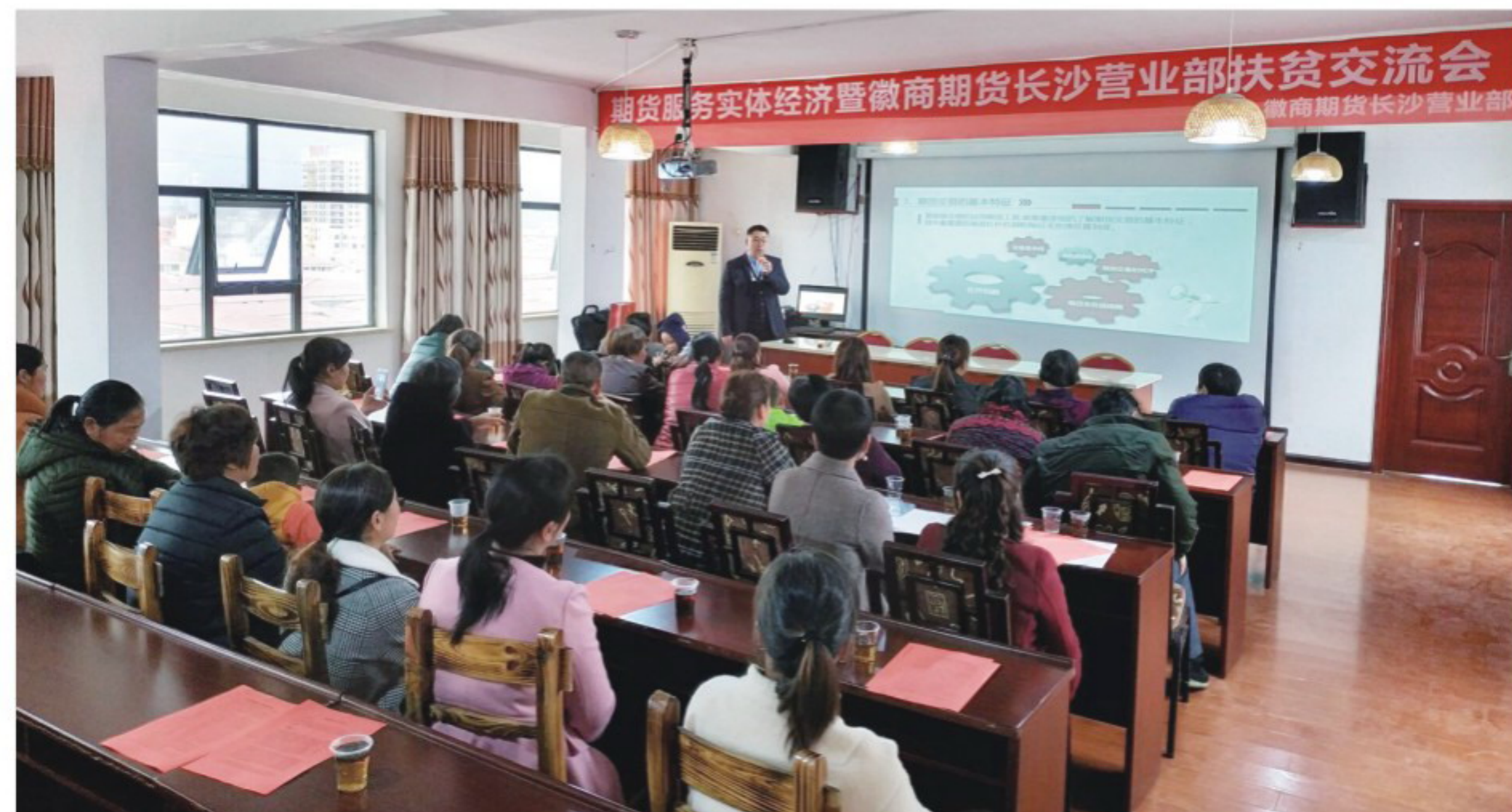
▲徽商期货扶贫交流会