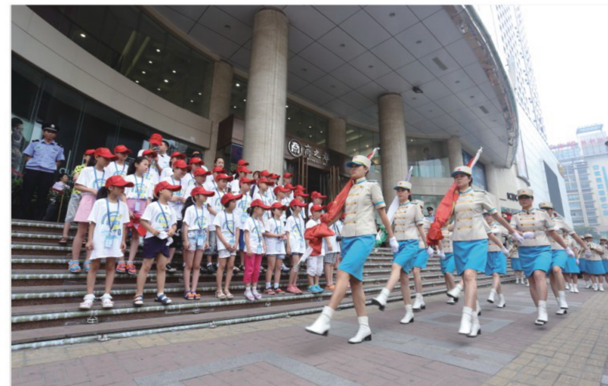
▲安徽商之都升旗仪式

热情接待来访，寻求解决方案。积极组织慰问困难党员职工、“金秋助学”、“送温暖”、“送清凉”等活动，传递组织关怀和温暖。迅速广泛动员救助突发重大疾病员工，真正体现“徽商一家亲”。