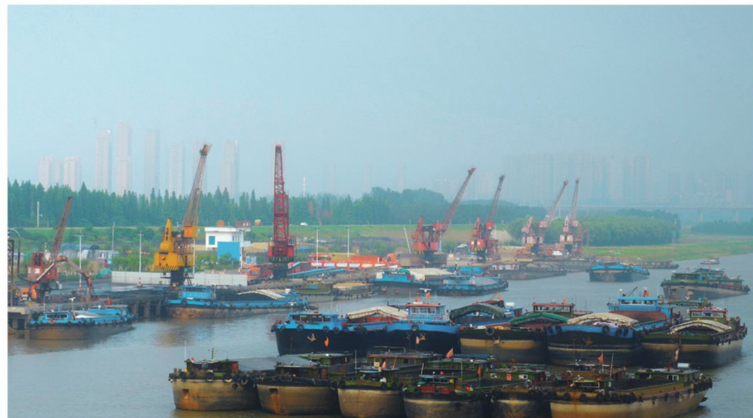
▲徽商五源国际物流港

推进资产盘活，加快土地收储和闲置土地开发，徽商城利用闲置房产打造云创产业园，合肥市浚河路24号物资二库经营区土地完成收储。加大清欠力度，尤其是徽商金属公司清欠工作成绩明显。加快僵尸企业处置，全面完成8户企业、基本完成17户企业的处置工作。