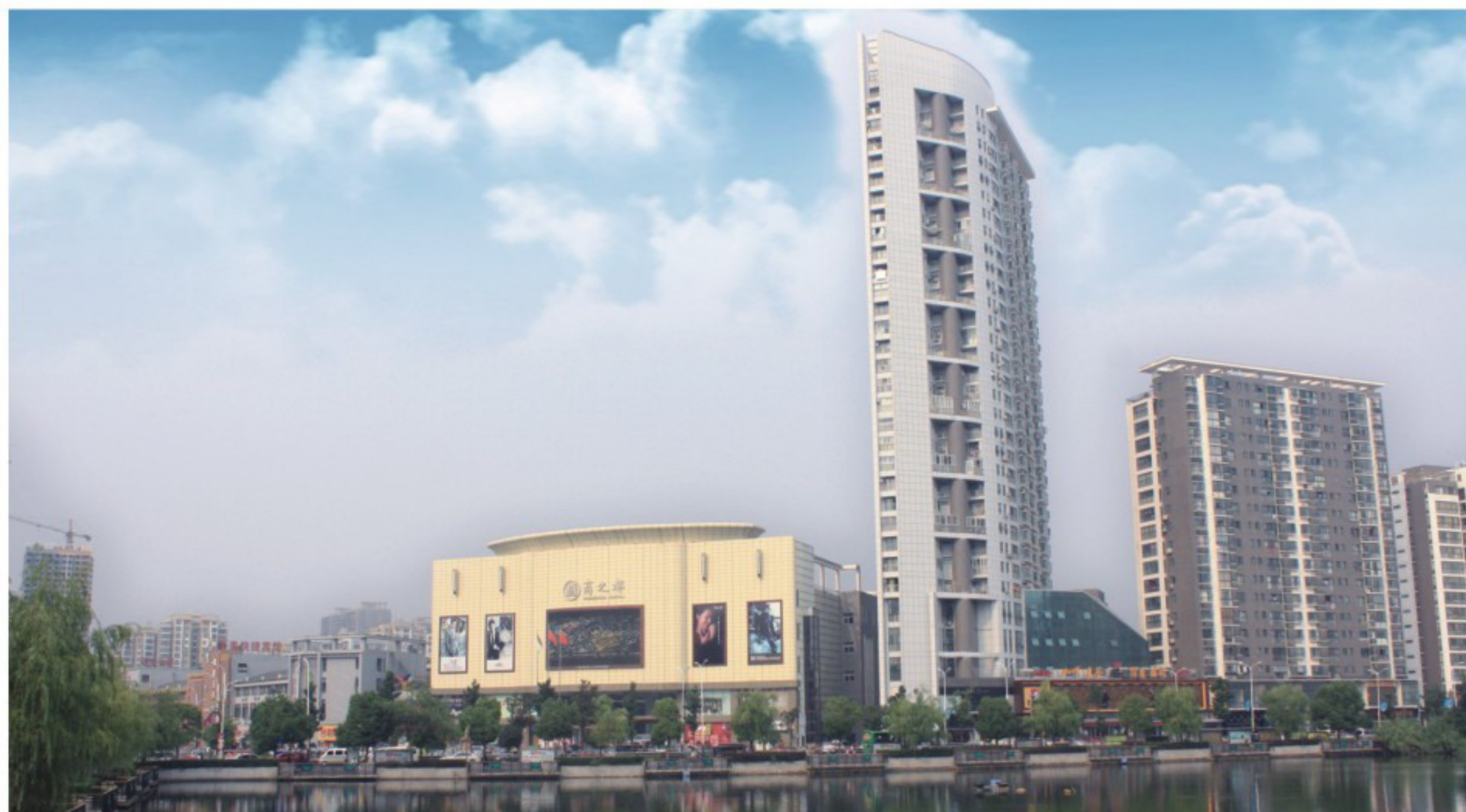
▲商之都六安商厦外景