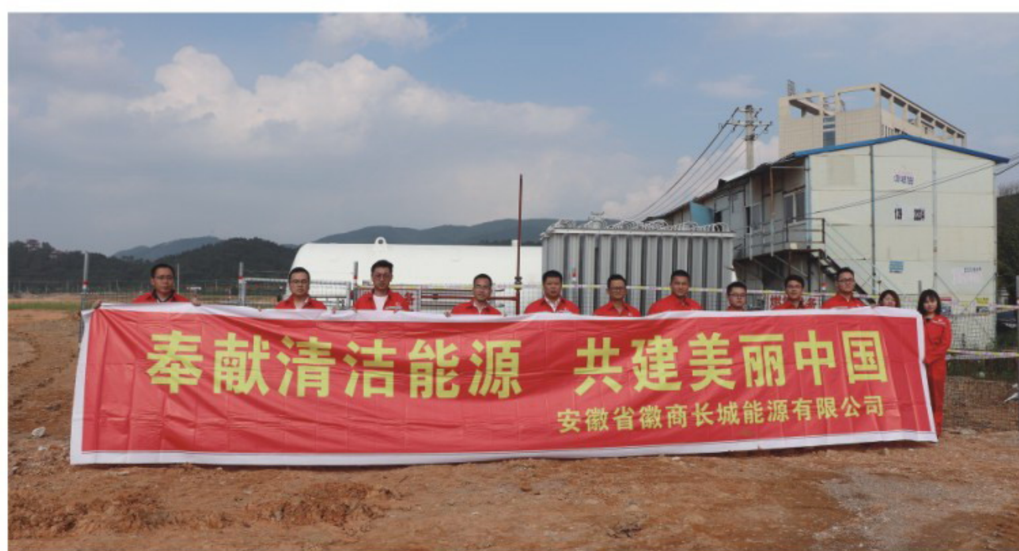
12月30日，徽商长城宿松支线通气点火仪式成功举行

与中石化合作成立徽商长城能源公司，开拓宿松天然气市场，实现公司当年组建、当年点火、当年盈利。